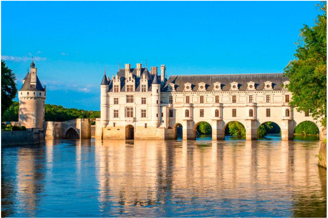
Замок Шенонсо и Тулуза