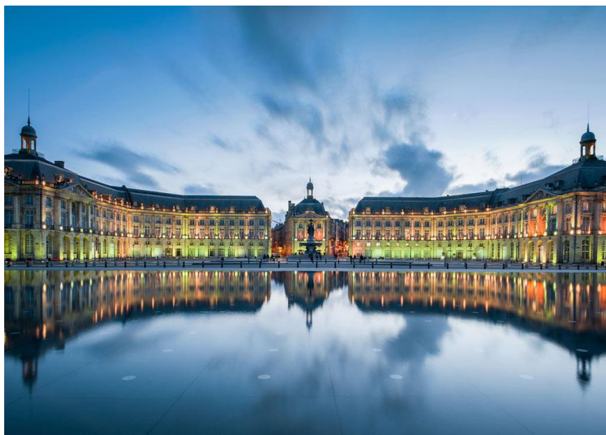
Бордо и Каркассон

Информация и резервирование АЛЕКСАНДР (718) 419-3712, 10 AM – 10 PM; any day.